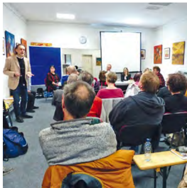
Informationsveranstaltung zum Metzgergrün

In der Folge fanden im Juli 2017, im März und im Juli 2018 im Quartiersladen Informationsveranstaltungen mit der Freiburger Stadt, dem Stadtplanungsamt und