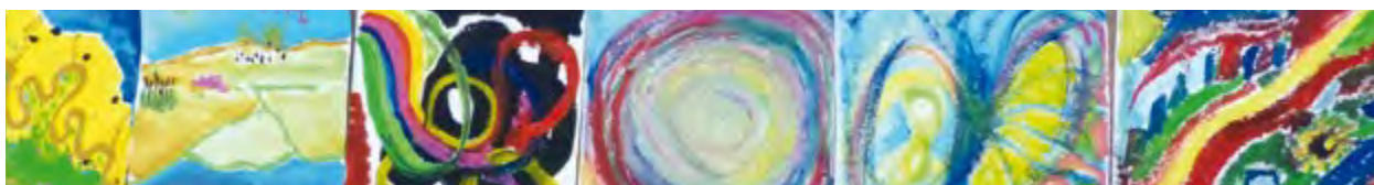
Kreativwerkstatt Haslacher Netz

Nachbarschaftswerk e.V., Sparkasse Freiburg, IBAN: DE17 6805 0101 0002 0134 59