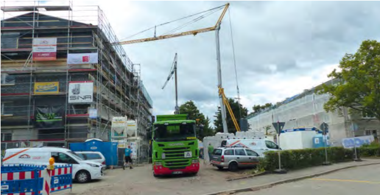
Sanierungsgebiet Haslach Süd-Ost