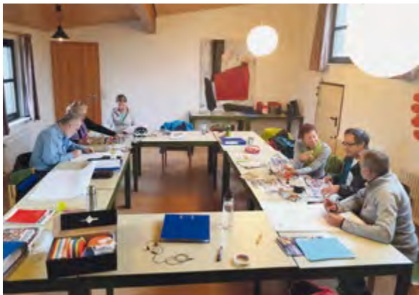
Unterricht bei den Alltagsbegleiter_innen

Wichtig in diesem Zusammenhang war unser „Filetstück“, das Einzelcoaching. Hier konnte nah am Menschen unterstützt werden bis hin zu systemisch-psychologischem Coaching bei Teilnehmenden, die den Gang zum Psychologen scheuten, aber mit lange eingeübten Mustern und Blockaden nicht weiterkamen. Auch die engmaschige Betreuung während der Probezeit und teilweise darüber hinaus, um Schwierigkeiten schnell zu begegnen, war Teil des Erfolges. Mit dieser Nachbetreuung konnten wir auch die Nachhaltigkeit gewährleisten.