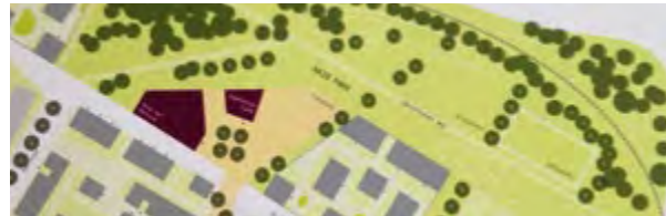
Siegerentwurf Rahmenkonzept Haid

ger ertragen werden will. Allerdings muss aus ihrer Sicht mit einer Neubebauung gewährleistet werden, dass es für sie weiter möglich sein muss, im Quartier wohnen bleiben zu können und dass die Mieten bezahlbar bleiben. Wenn es nach den Bewohner_innen gehen würde, sollte die Umsetzung nun so bald wie möglich erfolgen. Im kommenden Jahr 2019 soll es dazu wohl nun einen Aufstellungsbeschluss geben, so dass das Verfahren hoffentlich Fahrt aufnimmt.