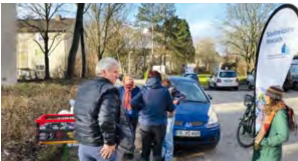
Quartiersarbeit vor Ort

In den vergangenen zwei Jahren waren die Umsiedlung der Bewohner_innen und der begonnene Abriss der ECA-Siedlung, die Entwicklung im Neubauquartier Gutleutmatten, das Gebiet Alt-Haslach, die Sanierung der Brandelanlage und das Thema „Älter werden im Quartier“ von besonderer Bedeutung.