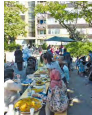
Fest der Nachbarn im 3. Hof

Das Fest hat so viel Gefallen gefunden, dass im Herbst das Nachbarschaftspicknick im 3. Hof wiederholt und mit einem Flohmarkt verbunden wurde.