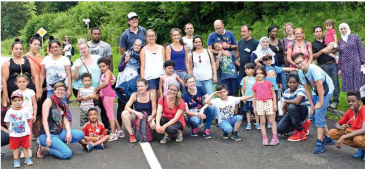
Ausflug in den Steinwasenpark 2017