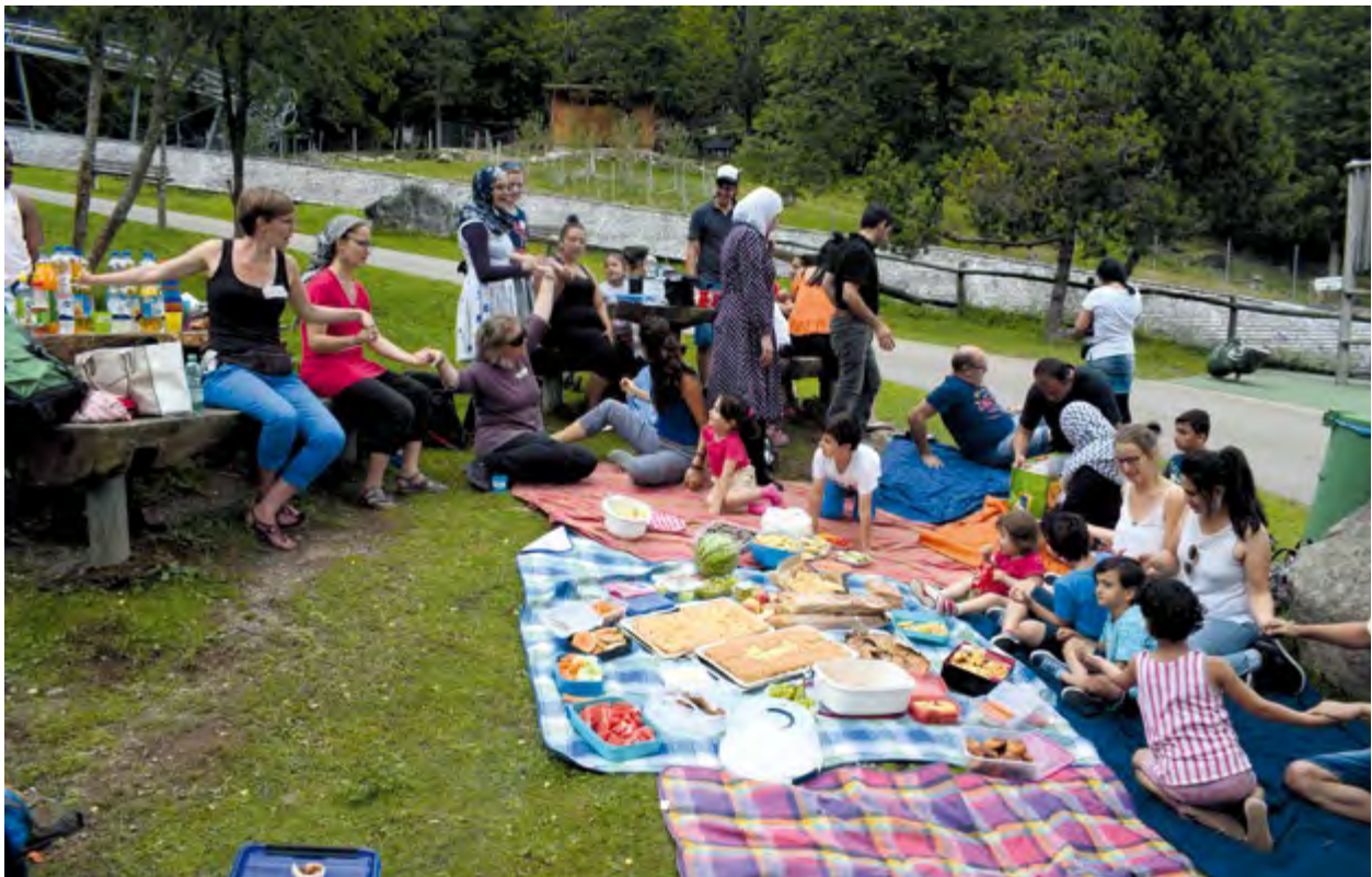
Ausflug in den Steinwasenpark 2017 – Quartiersarbeit Weingarten