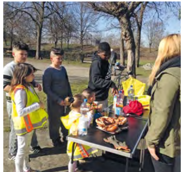
Aktion „Freiburg packt an“ im Lindenwäldle