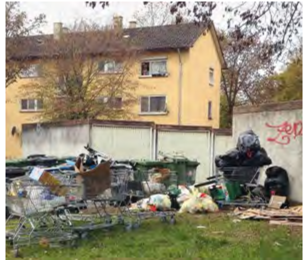
Müll im Quartier

Die eskalierte Situation in einem Haus am südlichen Ende des Lindenwäldles in Verbindung mit Vermüllung und angespanntem Nachbarschaftsverhältnis zu einer Mietpartei im Haus hat in den Jahren 2017 und 2018 dazu geführt, dass die Quartiersarbeit um einen Fachaustausch bat, an dem dann Vertreter der FSB, des KSD, des AMI und der Polizei teilnahmen. Nach einem zweiten Treffen wurden von Seiten der FSB und des AMI Maßnahmen vereinbart, die in Verbindung mit Wegzug dann letztendlich dazu führten, dass die Situation sich beruhigte. Aktuell sind in diesem Haus vier Wohnungen unbewohnt. Aufgrund des desolaten Zustandes müssen sie zuerst wieder instand gesetzt werden.