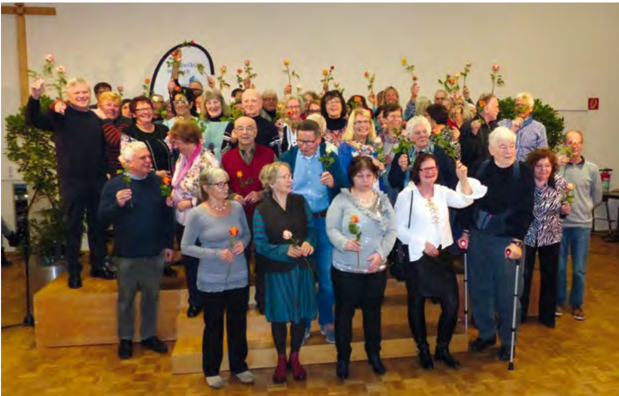
Dank an die Ehrenamtlichen – Dankeschönfest 2017

folgende Projekte und Angebote wie „Freiburg miteinander“, „Haslacher Netz“, „Haslacher Mittagstisch“, „Hofmusikfest“ und Engagement im Rahmen der Quartiersarbeit umgesetzt werden.