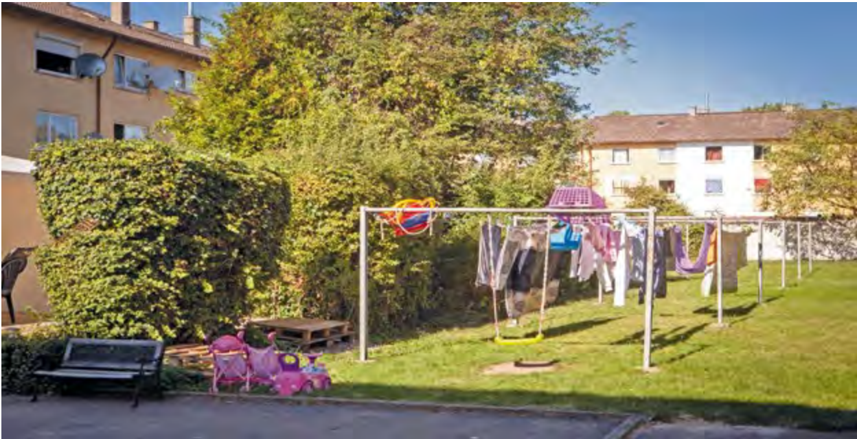
Wohnquartier Am Lindenwäldle