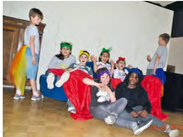
Theatergruppe an der Pestalozzischule

Im Mai 2019 wurde das selbstgeschriebene Märchen-Stück „Der Bauer und seine eigenwilligen Kinder“ aufgeführt werden.